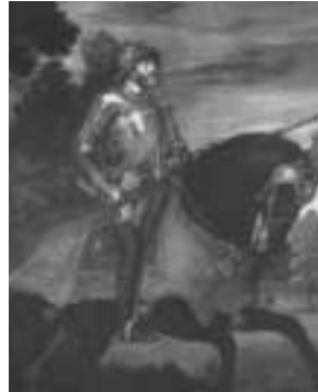
Mühlberg - Titiaan 1547

Dit alles wordt haarfijn uiteengezet en opgesmukt met prachtige afbeeldingen van schilderijen en oorkonden en het is werkelijk het meest volledige en mooiste uitgegeven boek over Karel V, waarvoor het Mercatorfonds alle lof verdient. Het is een prima naslag- en studiewerk, maar ook een schitterend geschenkboek. Met formaat 34 x 26 cm., met 531 blz en 500 illustraties, waarvan 400 in kleur, linnenband met goudstempeling, geplastificeerde stofomslag, en met koker, bedraagt de prijs 121,40 euro. Er is in een nederlandstalige, franse of engelse versie te verkrijgen.